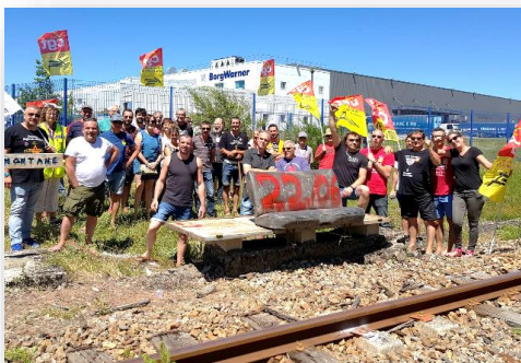
Limoges, le 22 juin 2018