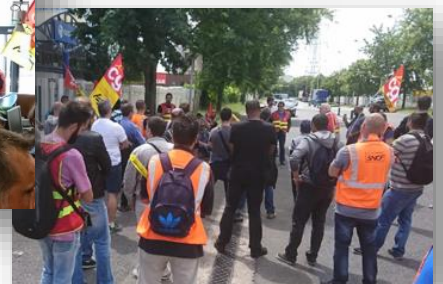
Secteurs parisiens, le 22 juin 2018