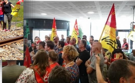
Rennes, le 22 juin 2018