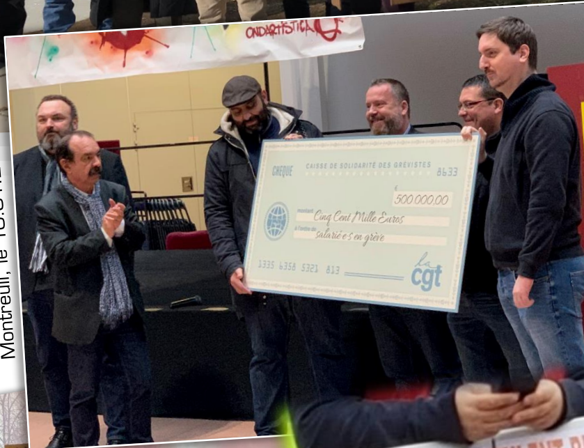
Montreuil, le 10.01.20