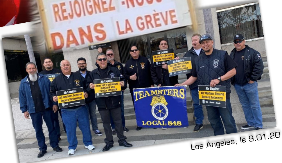
Los Angeles, le 9.01.20