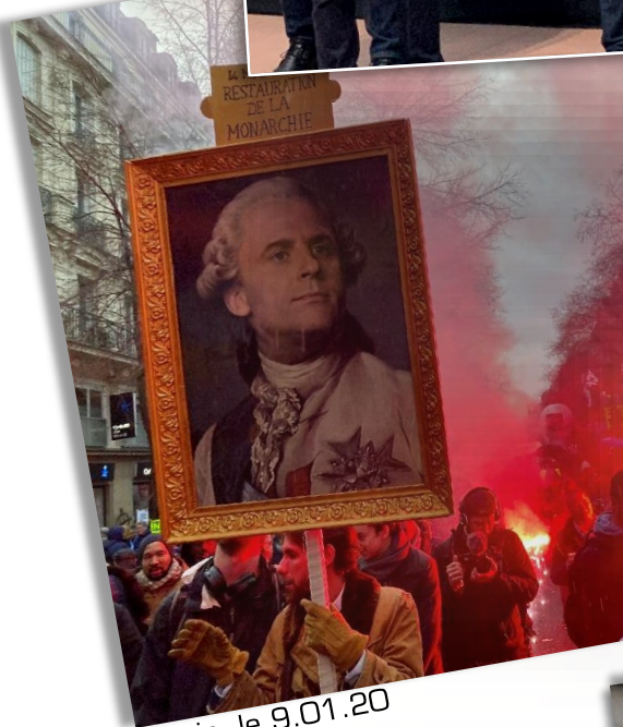
Paris, le 9.01.20