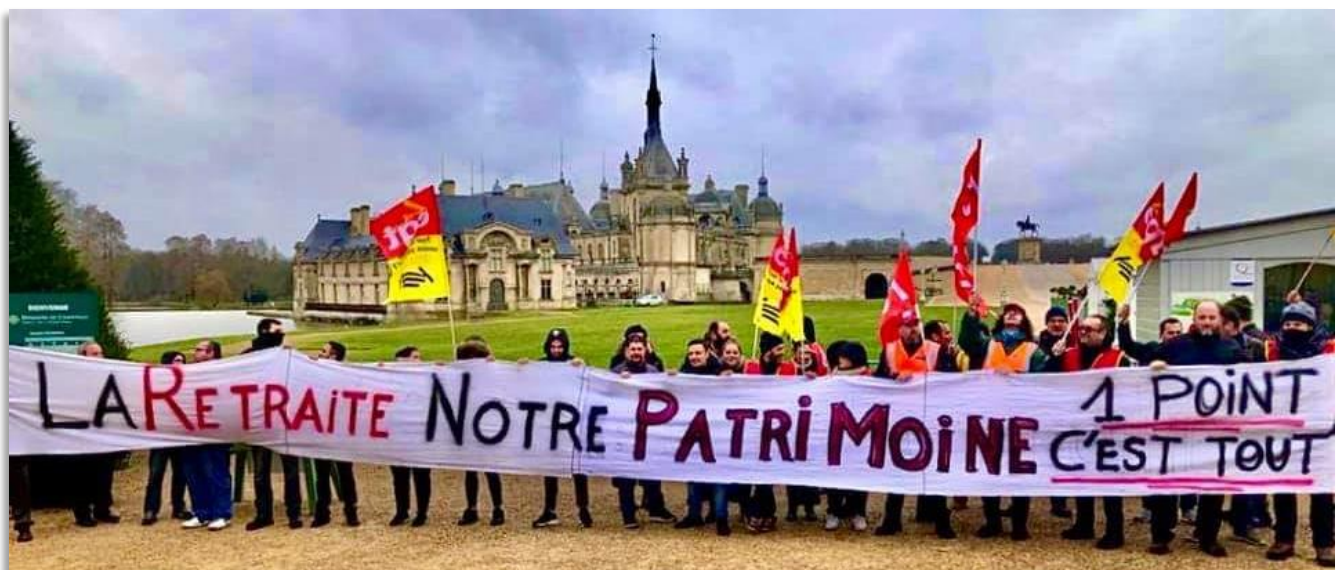
Château de Chantilly – syndicat de Creil, le 10.01.20