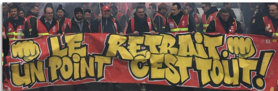
Lyon, le 9.01.20

Les organisations syndicales CFE-CGC, CGT, FO, FSU, MNL, Solidaires, UNEF, UNL appellent le 14 janvier à une journée de grève et de convergence interprofessionnelle localement dans tout le pays qui s'inscrit dans la continuité d'actions et d'initiatives déclinées sous toutes les formes les 15 et 16 janvier. Elles appellent à réunir partout les assemblées générales pour mettre en débat les modalités permettant de poursuivre la mobilisation dans le cadre de la grève lancée le 5 décembre.