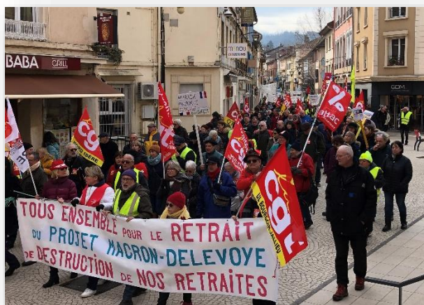
Bourgoin-Jallieu, le 06.02.2020

Alors, toutes et tous ensemble les 13 et 20 février prochains !