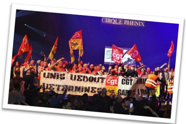
Concert de soutien aux grévistes au Cirque Phénix le 20 janvier.